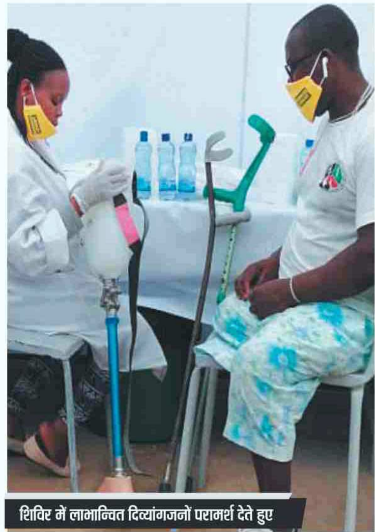
शिविर में लाभान्वित दिव्यांगजनों परामर्श देते हुए