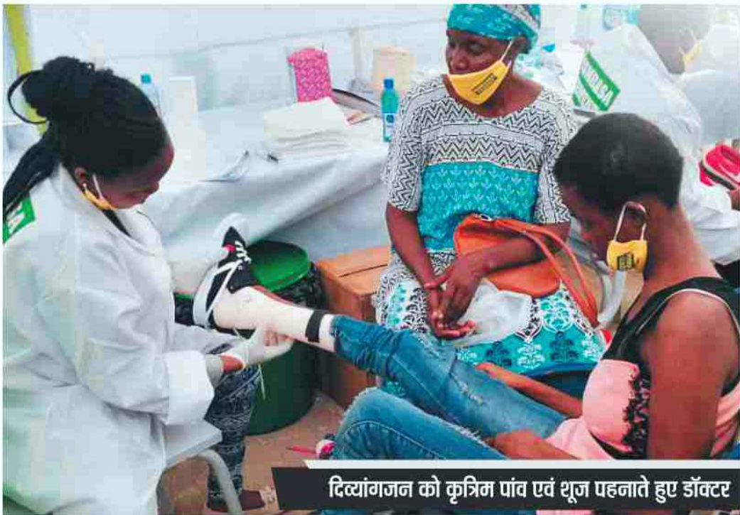
दिव्यांगजन को कृत्रिम पांव एवं थूज पहनाते हुए डॉक्टर